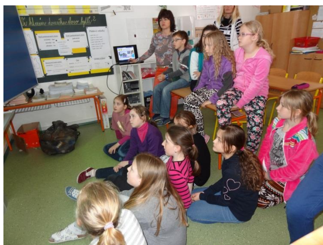
Na interaktivní tabuli jsme si vysvětlili princip spaloven a skládek. ( www.tonda-obal.cz )

Další možností je odpad třídit a recyklací šetřit přírodu i nerostné suroviny. Nejprve jsme si pomocí hry vysvětlili, co kam patří.